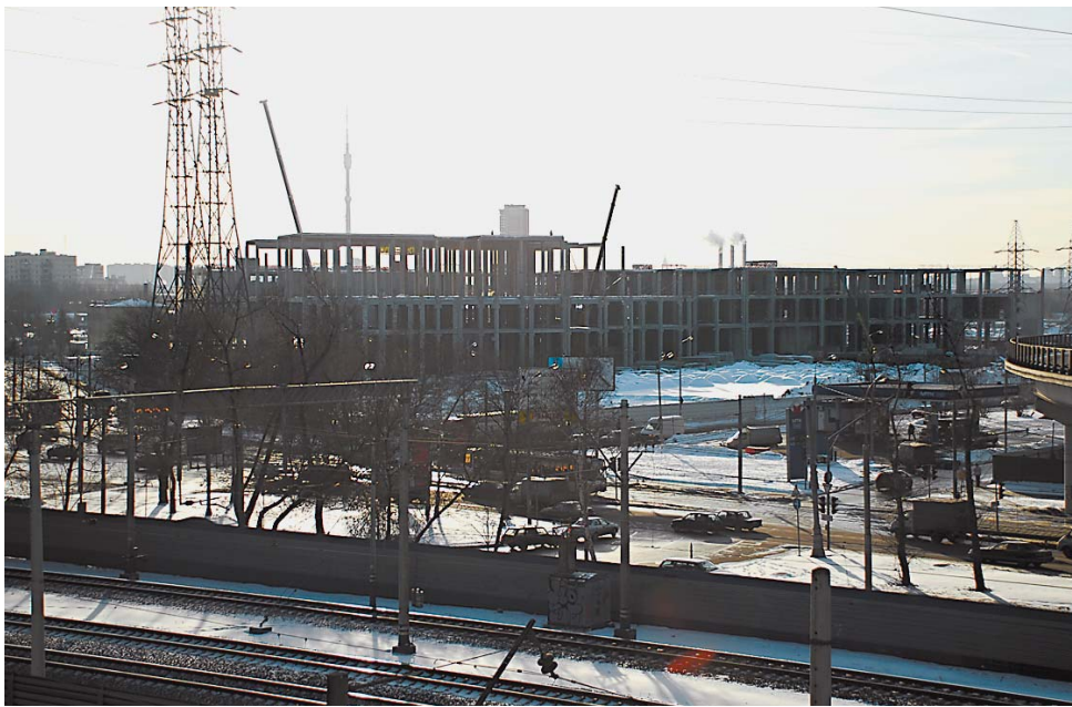
Здесь будет 5 кинотеатров, гипермаркет, стоянка на 6 тысяч машин

— Наша компания специализируется на строительстве торгово-развлекательных центров. Примерами нашей работы могут служить «Золотой Вавилон» в