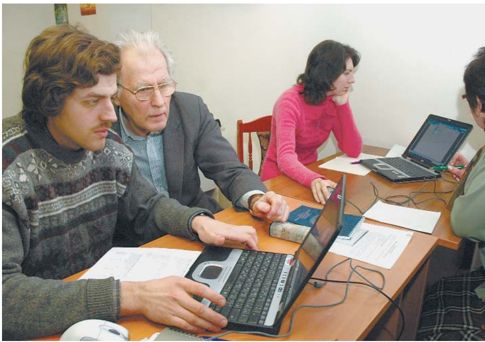
В компьютерном классе 9 человек. Пока...

— В наше время не обойтись без знания компьютера. С его помощью люди с ограниченными возможностями смогут расширить круг общения, получить новые знания, вновь начать работать. Поэтому, когда к нам обратились с просьбой по-