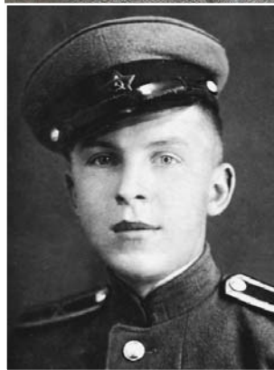
40-е годы. Юный кадет

рович объехал почти весь север страны. Он служил в Архангельске, Мурманске, Североморске, на Новой Земле и полуострове Рыбачий, объездил все побережье Белого моря.